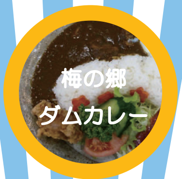
梅の郷 ダムカレー