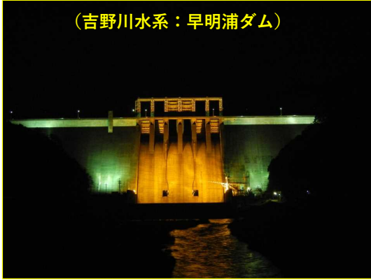
(吉野川水系：早明浦ダム)