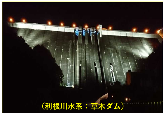
(利根川水系：草木ダム)