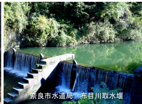
奈良市水道局 布目川取水堰