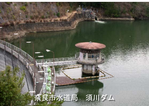
奈良市水道局 須川ダム