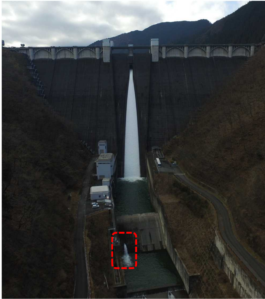
減勢工に貯めた水を放流し、減勢工に充水している写真