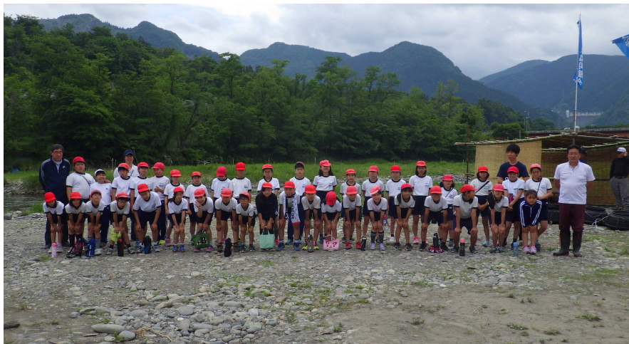
河川敷へ移動してアユの生態・放流についての説明を受けたのち、稚アユの放流。さいごに記念撮影