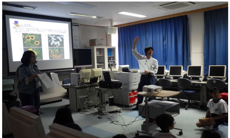
荒川東小学校においてダム周辺の環境についての学習