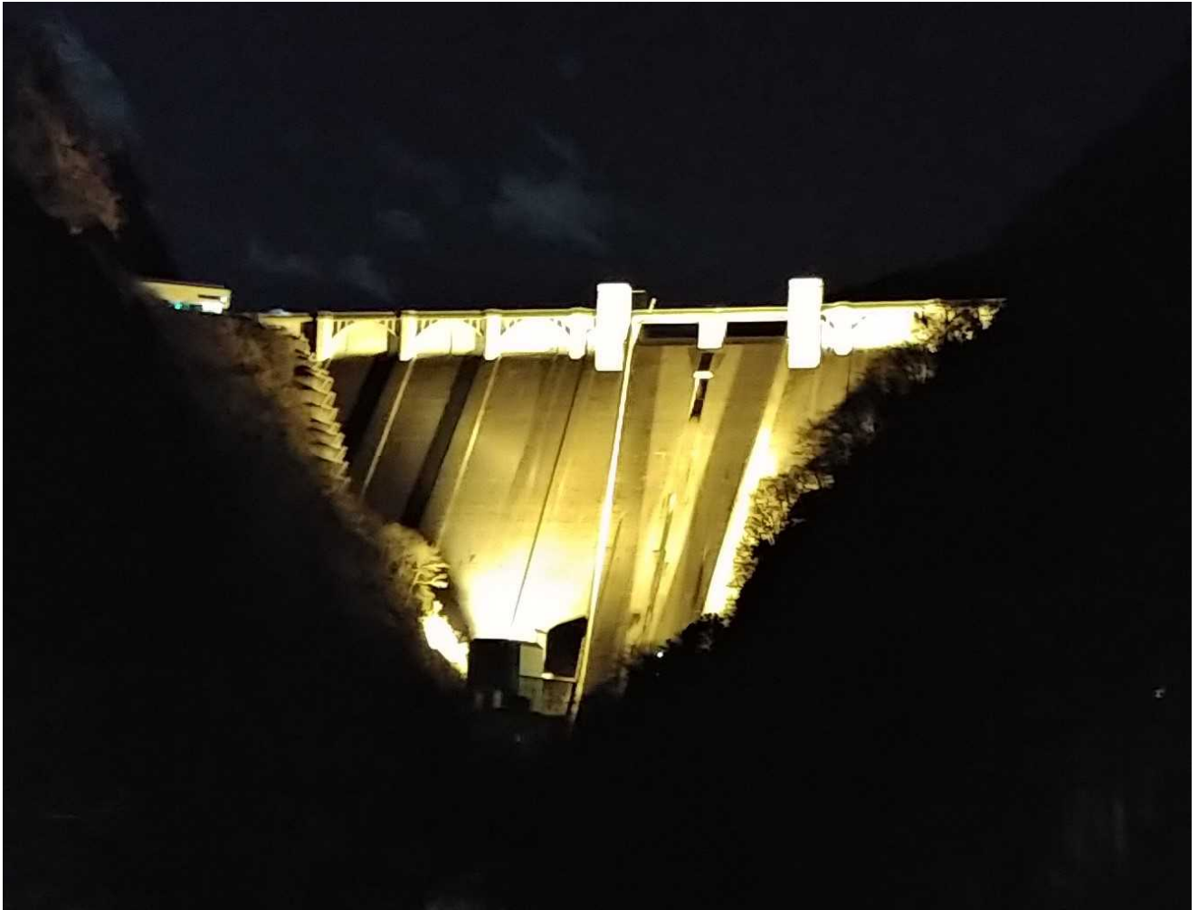
浦山ダム下流から撮影（令和2年12月25日）