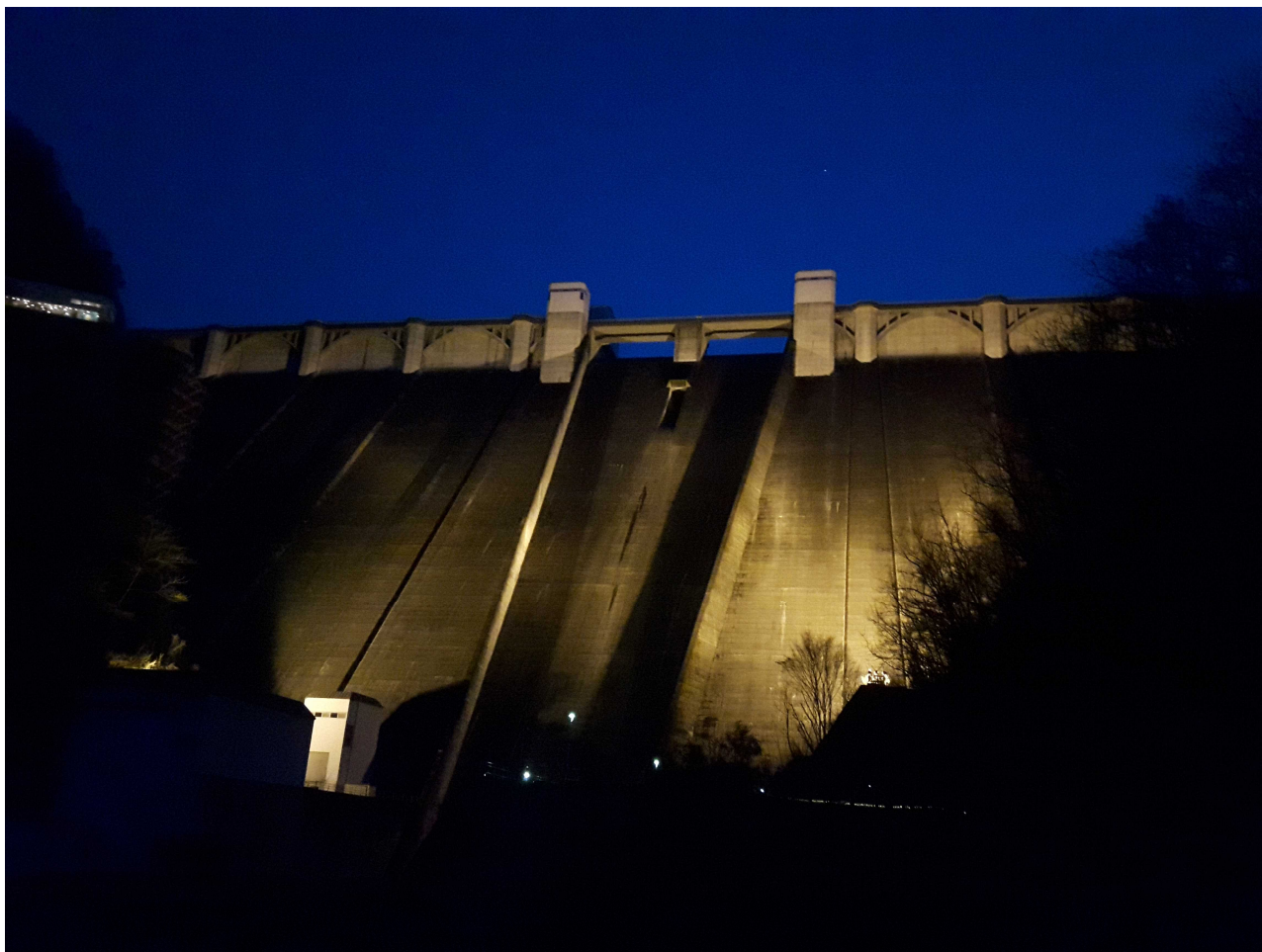
昨年のライトアップ（令和3年4月2日撮影）