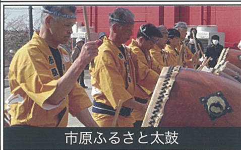
市原ふるさと太鼓