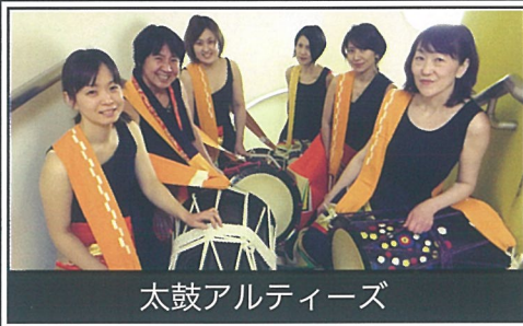
太鼓アルティーズ