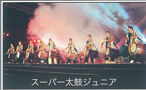
スーパー太鼓ジュニア