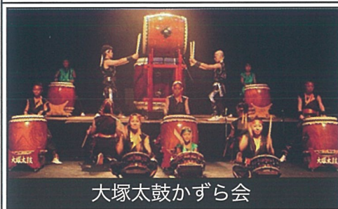
大塚太鼓かずら会