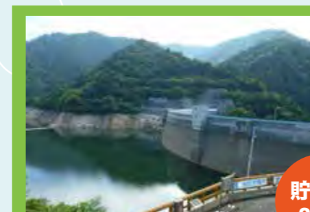
2016年8月1日の矢木沢ダム