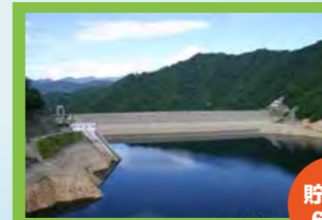
2016年8月1日の奈良侯ダム