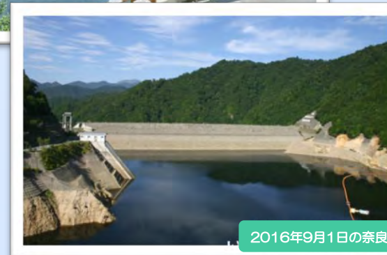
2016年9月1日の奈良保ダム