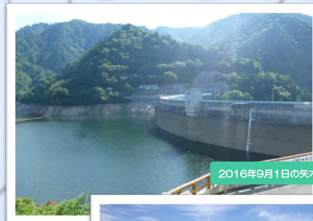
2016年9月1日の矢木沢ダム