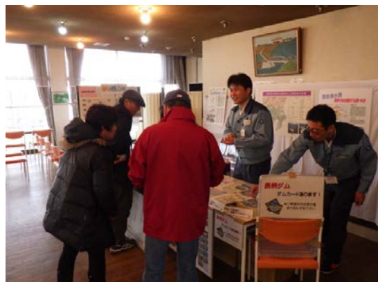
ダムカードも配布しました