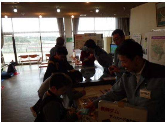
房総導水路事業所説明ブース