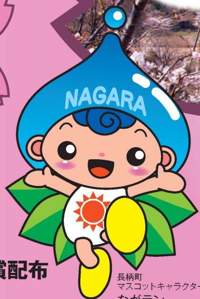
長柄町 マスコットキャラクター ながラン