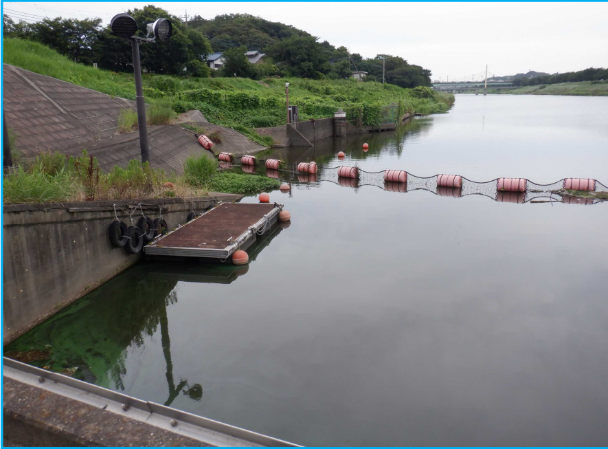
7㇁発生状況 写真No. 1