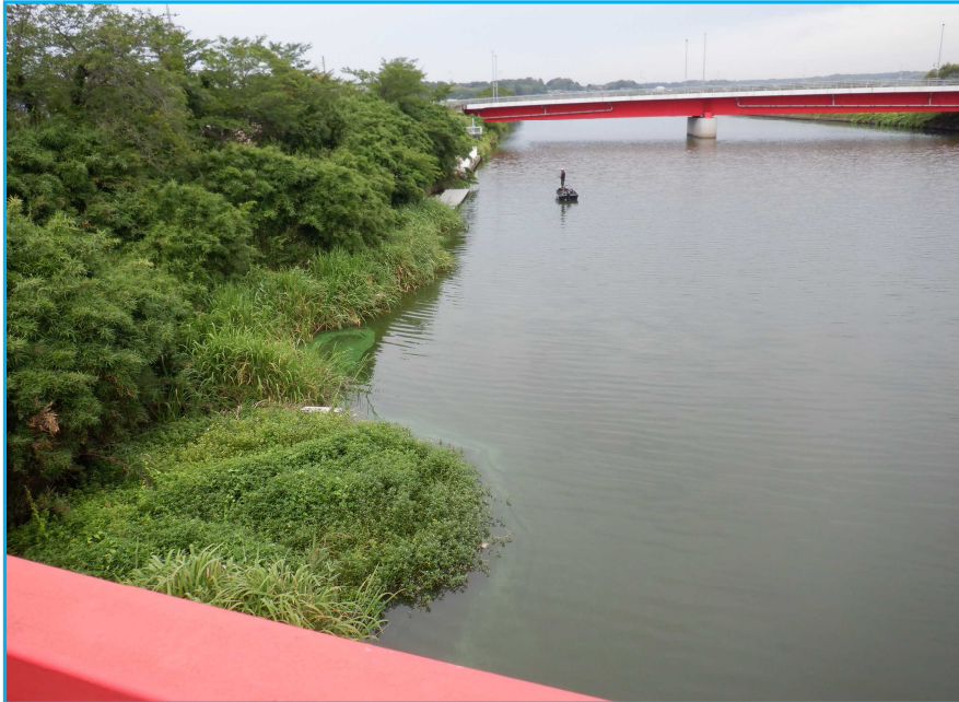
7才発生状況 写真No. 3