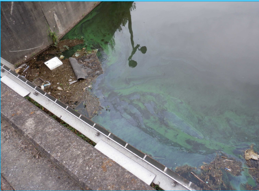
7㇁発生状況 写真No. 2