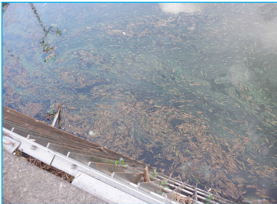
7ㄇ発生状況 写真No. 2