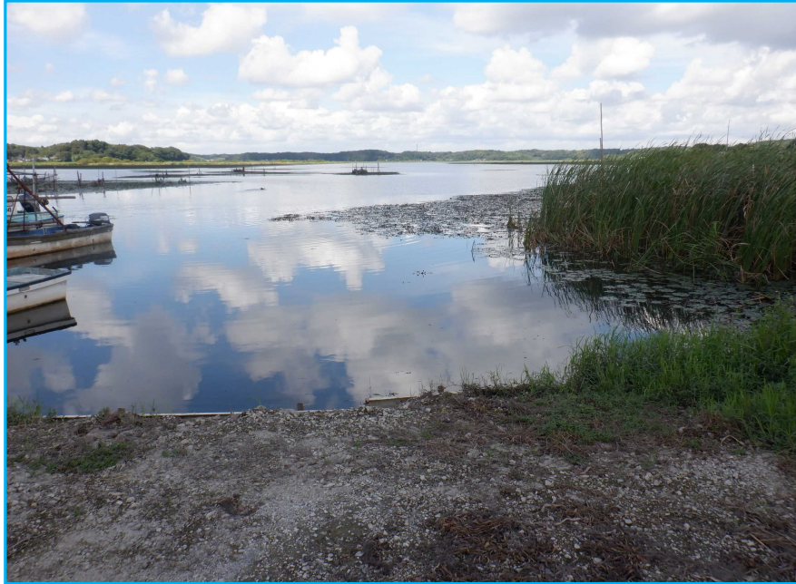
7才発生状況 写真No. 3