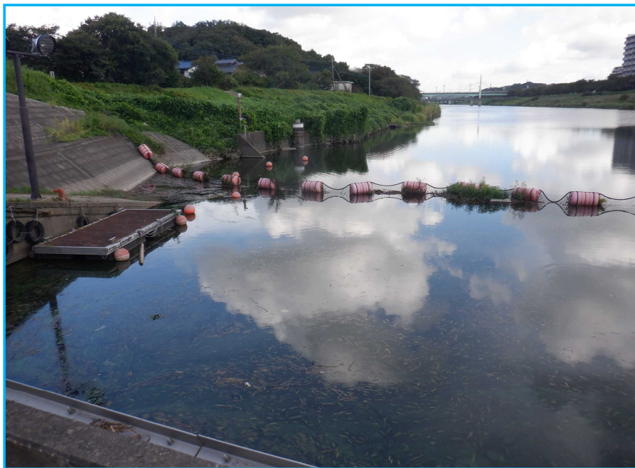
7ㄇ発生状況 写真No. 1