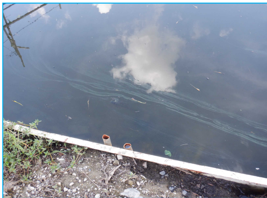
7才発生状況 写真No. 4