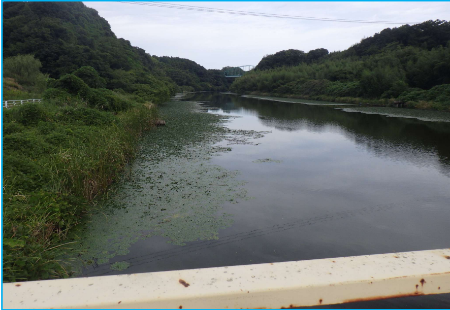
7㇁発生状況 写真No. 9