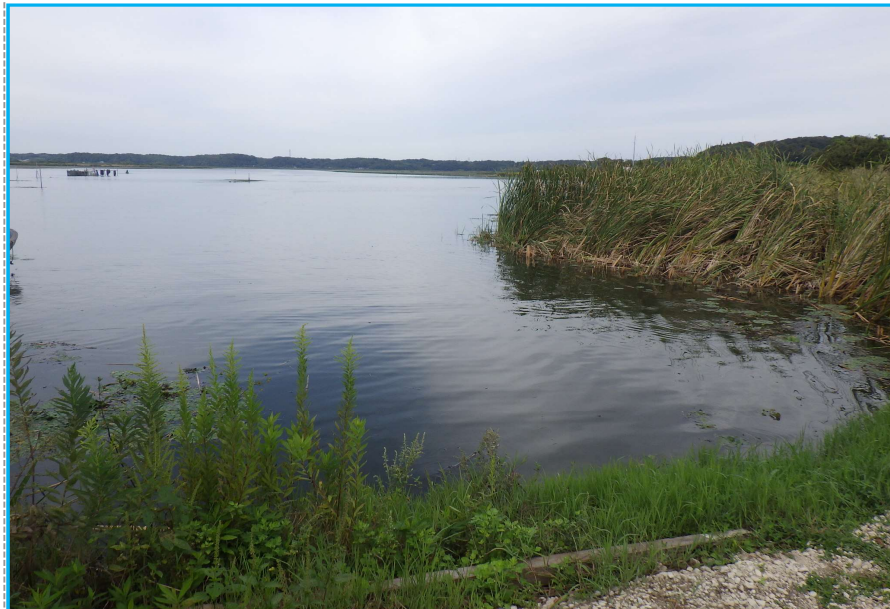
7才発生状況 写真No. 7