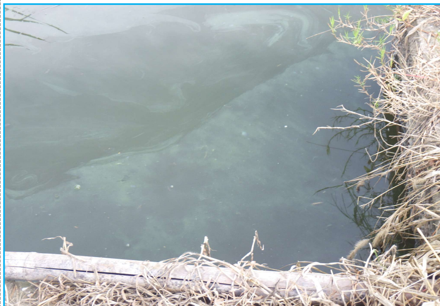
7㇁発生状況 写真No. 12