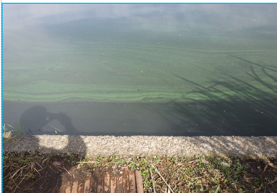
7才発生状況 写真No. 6