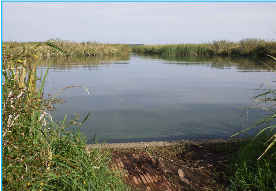
7才発生状況 写真No. 5