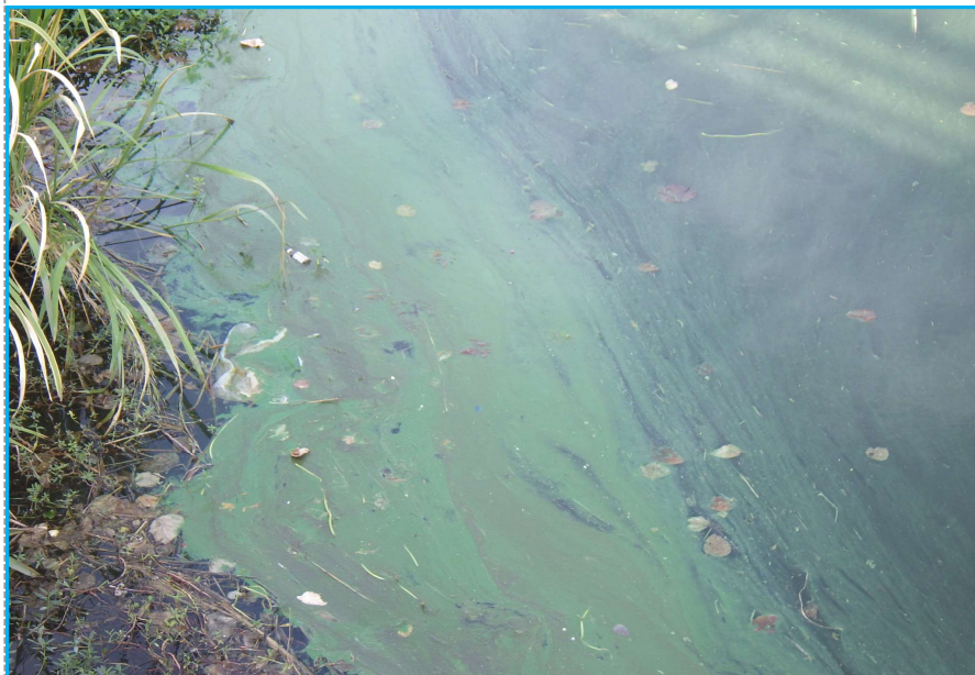
7才発生状況 写真No. 4