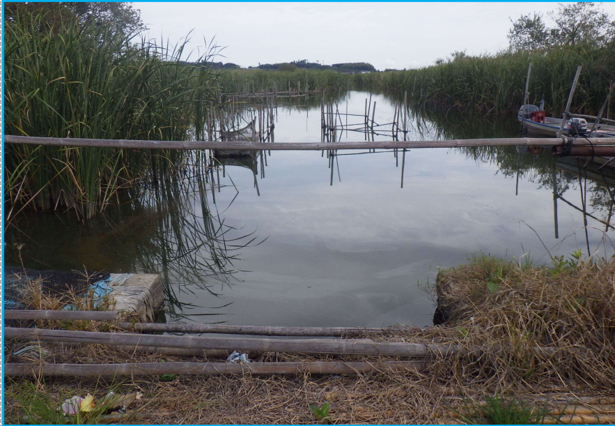
7㇁発生状況 写真No. 11