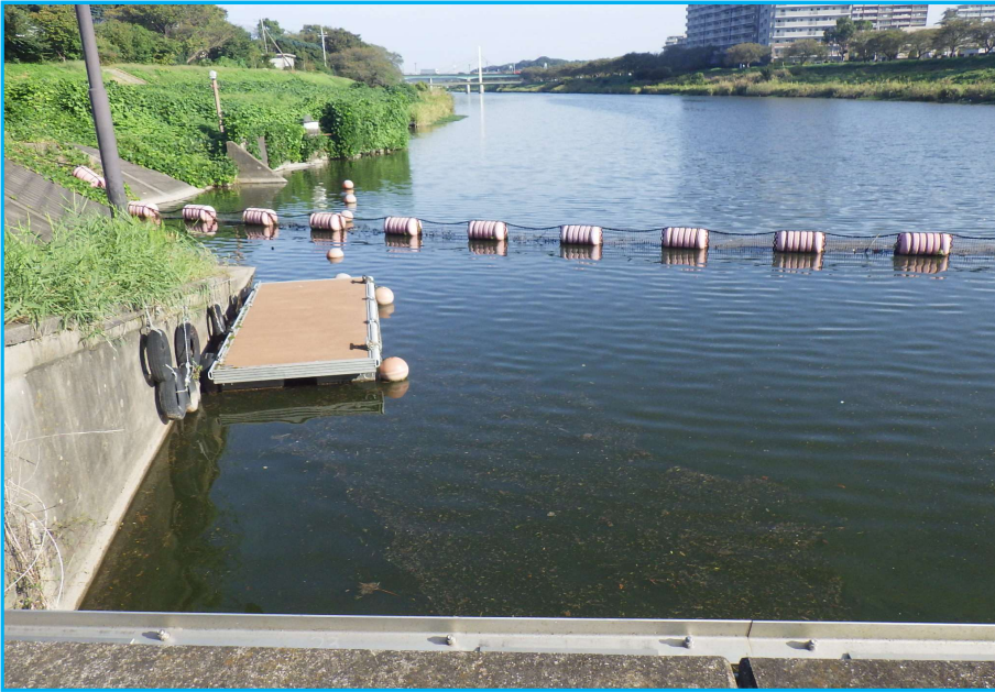
7ㄇ発生状況 写真No. 1