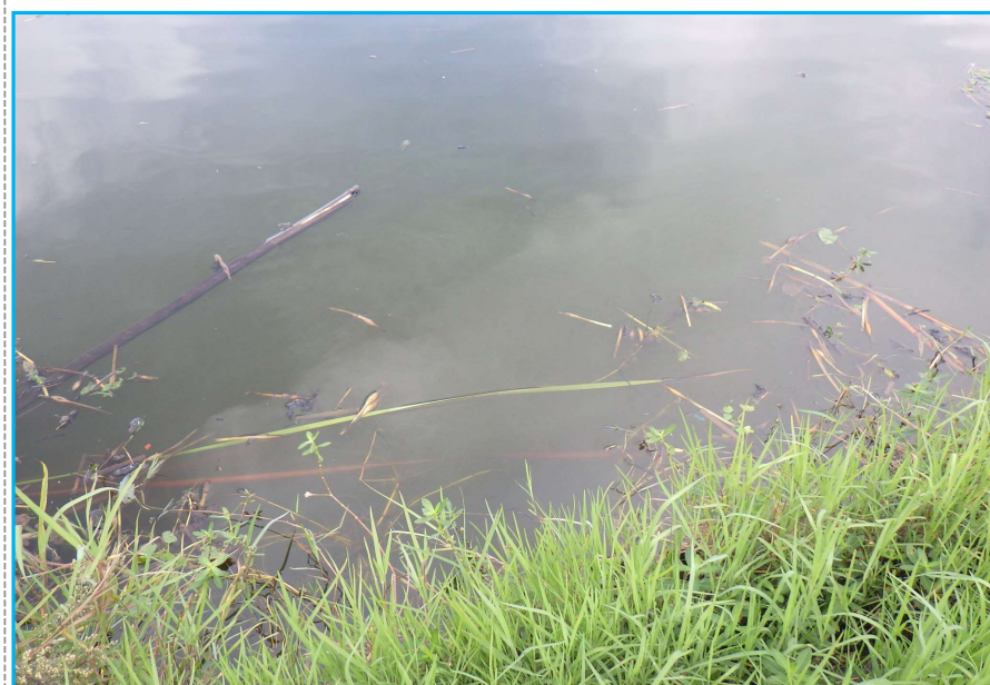
7才発生状況 写真No. 8