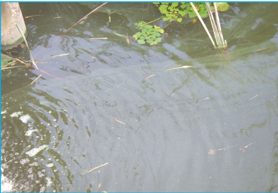
7㇁発生状況 写真No. 10