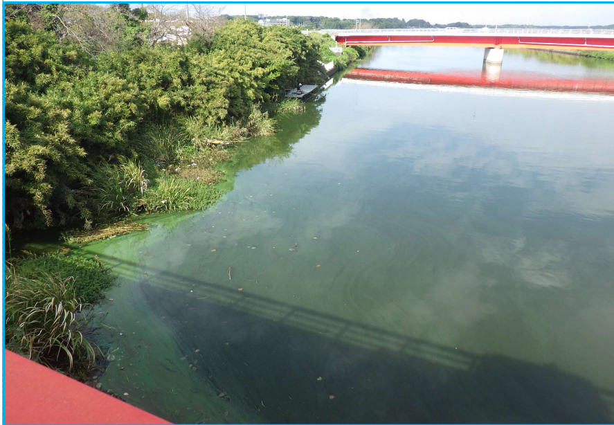
7才発生状況 写真No. 3