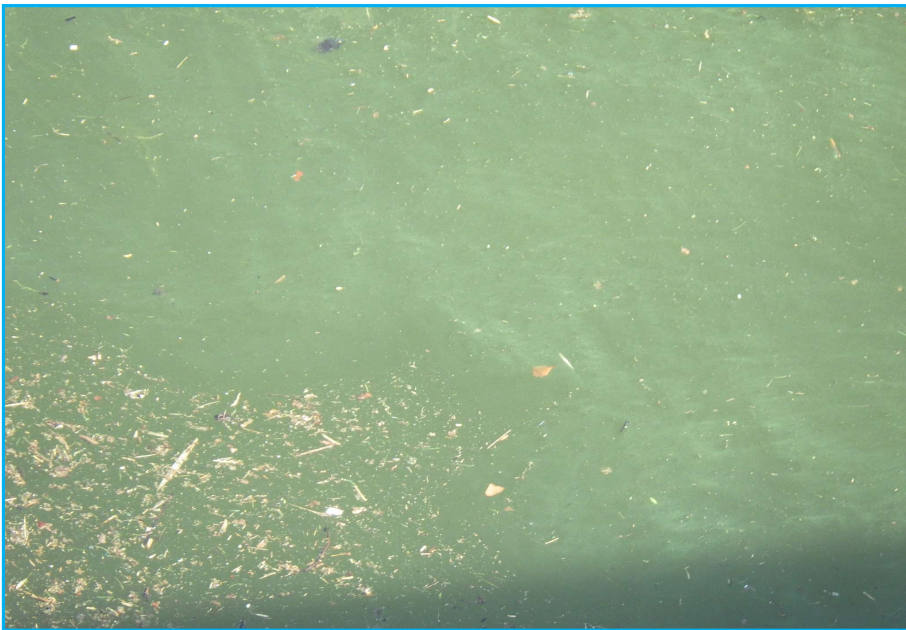
7ㄇ発生状況 写真No. 2