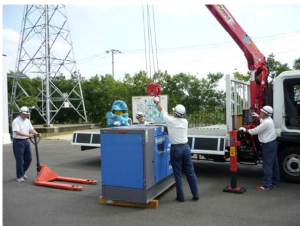
【発電機積み込み状況】