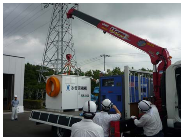
【ポンプユニット積み込み状況】