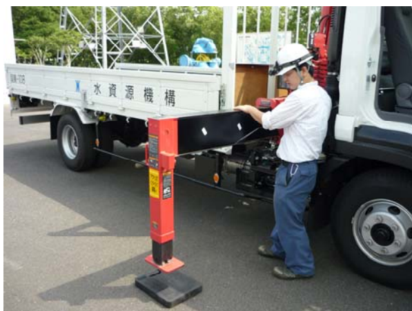
【クレーン付きトラック操作状況】