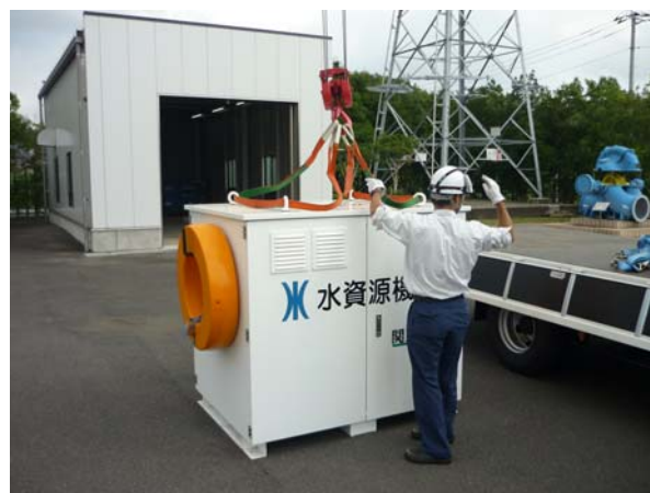
【ポンプユニット積み込み状況】