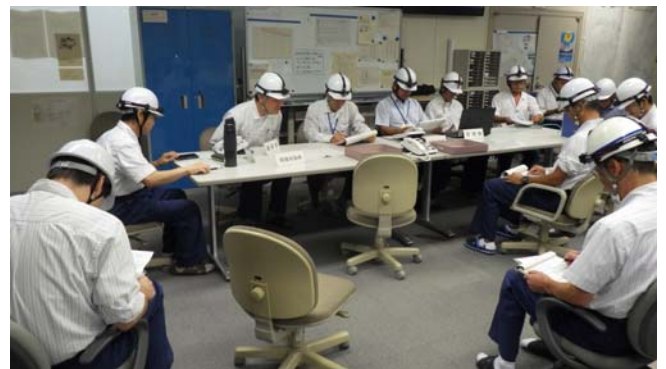
②防災本部設置完了