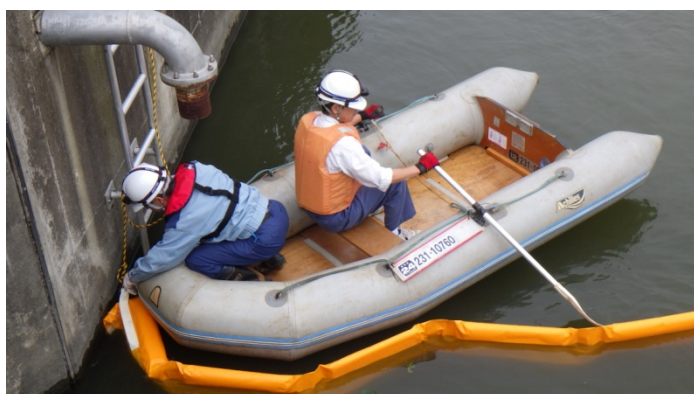
オイルフェンス設置訓練