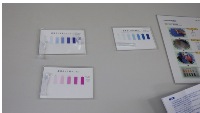
水質試験の結果、原水に異常なし