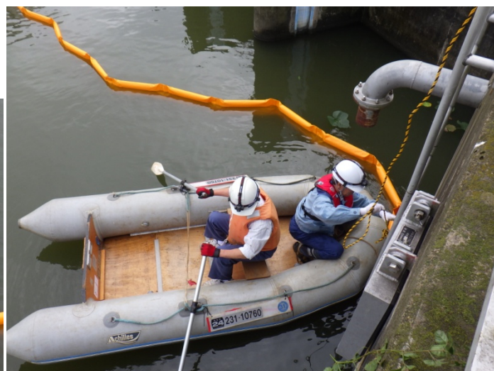
オイルフェンス設置訓練