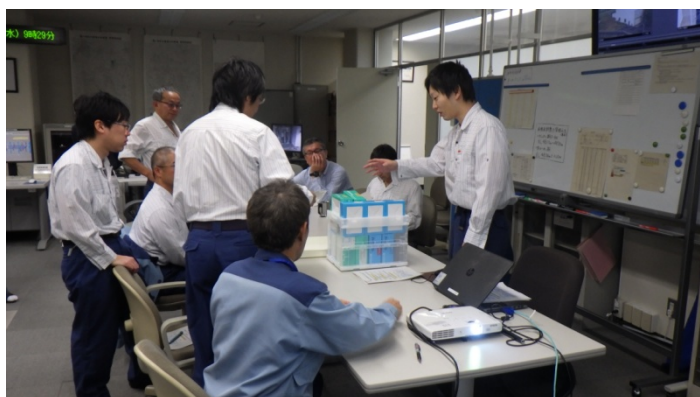
水質事故対応マニュアルの確認

当日は、水質事故対応マニュアルの確認や水質事故の原因を確認するための簡易パックテスト、オイルフェンスの設置訓練を行いました。マニュアルの内容では、水質事故発生の発見から職員、関係機関への連絡系統や対応策について、職員全員で確認を行いました。引き続き、吸水槽内において、オイルフェンスの格納場所の確認、設置方法の訓練を行いました。