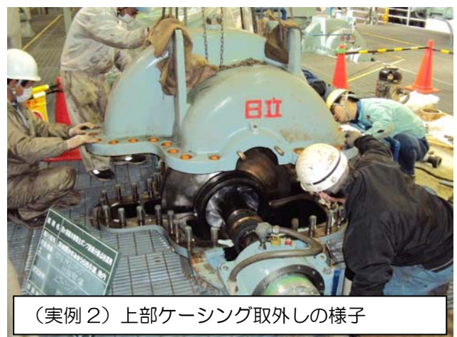
（実例 2）上部ケーシング取外しの様子