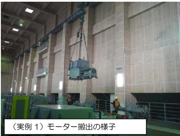
（実例 1）モーター搬出の様子