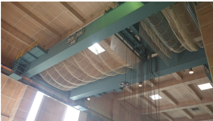
揚水機場に設置されている天井クレーン

当日（11月15日）は、クレーンの外観確認と実際に50 tの重りを吊り上げて異常が無いことを確認しました。