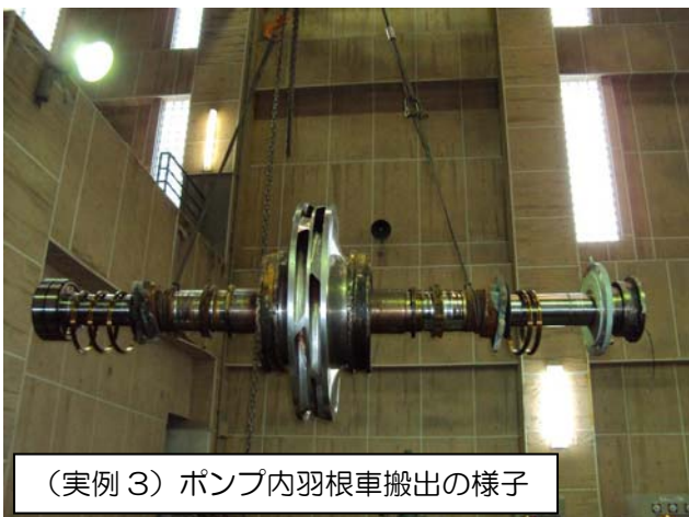
（実例 3）ポンプ内羽根車搬出の様子