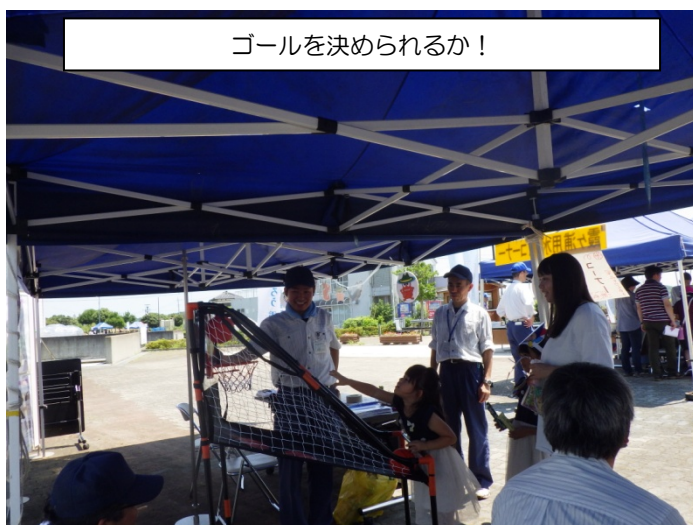
ゴールを決められるか！