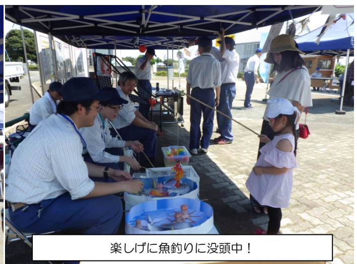
楽しげに魚釣りに没頭中！