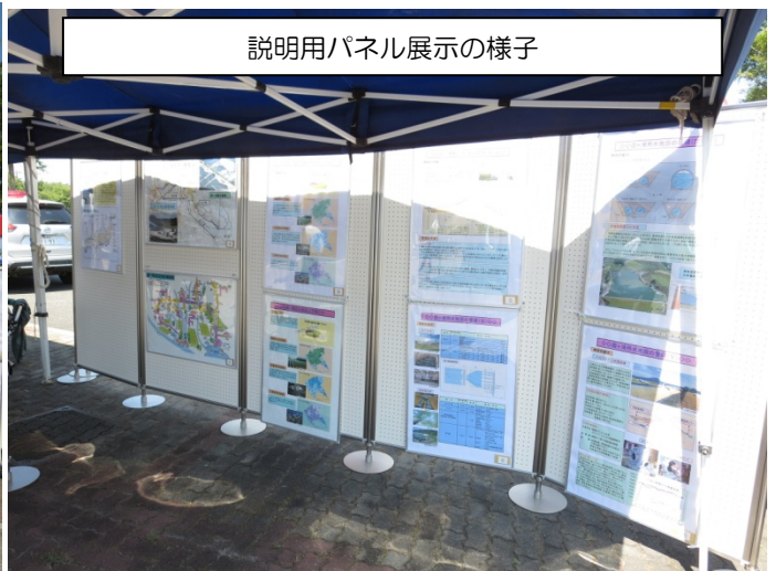
説明用パネル展示の様子