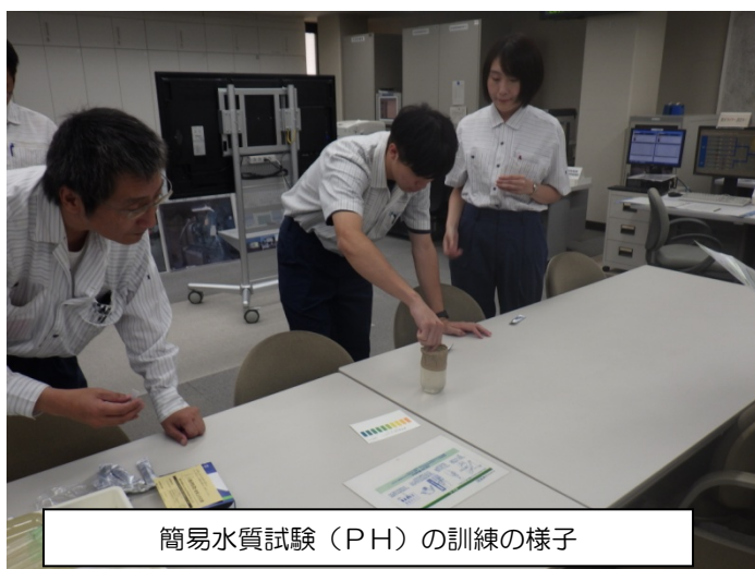
簡易水質試験（PH）の訓練の様子

霞ヶ浦用水は、霞ヶ浦を水源として農業用水、水道用水や工業用水の原水を取水し、供給しているため、事故発生時には関係機関と緊密に連携した対応が求められることから、いざという時のために、これからも随時、訓練を行ってまいります。