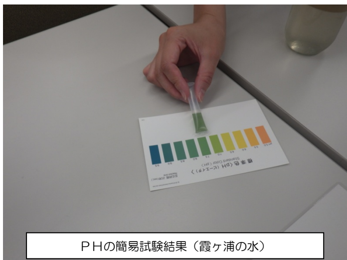
PHの簡易試験結果（霞ヶ浦の水）