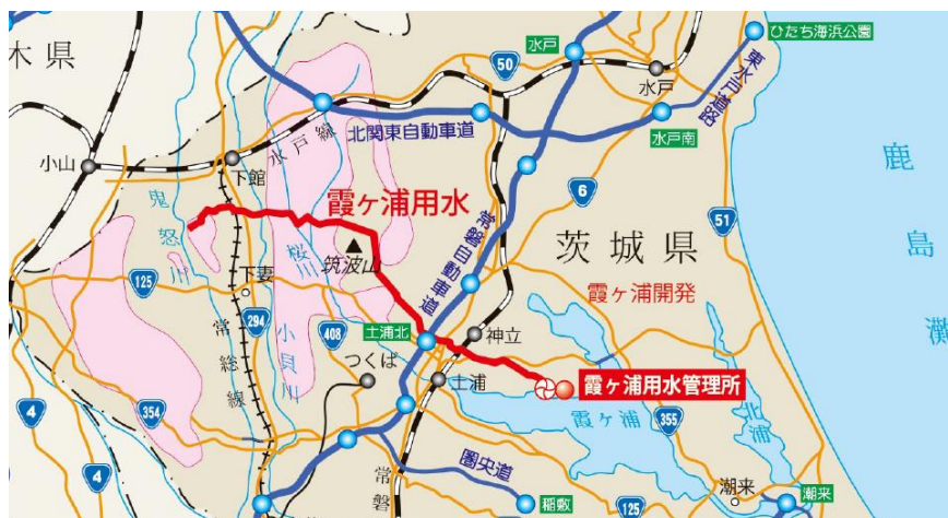
霞ヶ浦用水管理所 位置図

ナガエツルノゲイトウとは…指定外来生成物の水草。繁殖力が強く、水田・川・水路などにて通水阻害を引き起こす可能性がある。