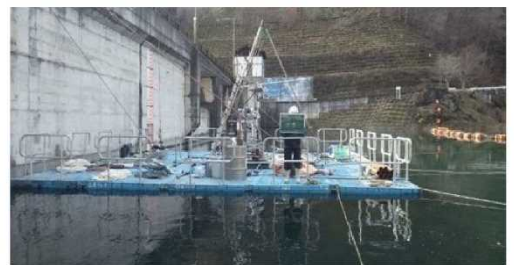
フロート台船設置イメージ