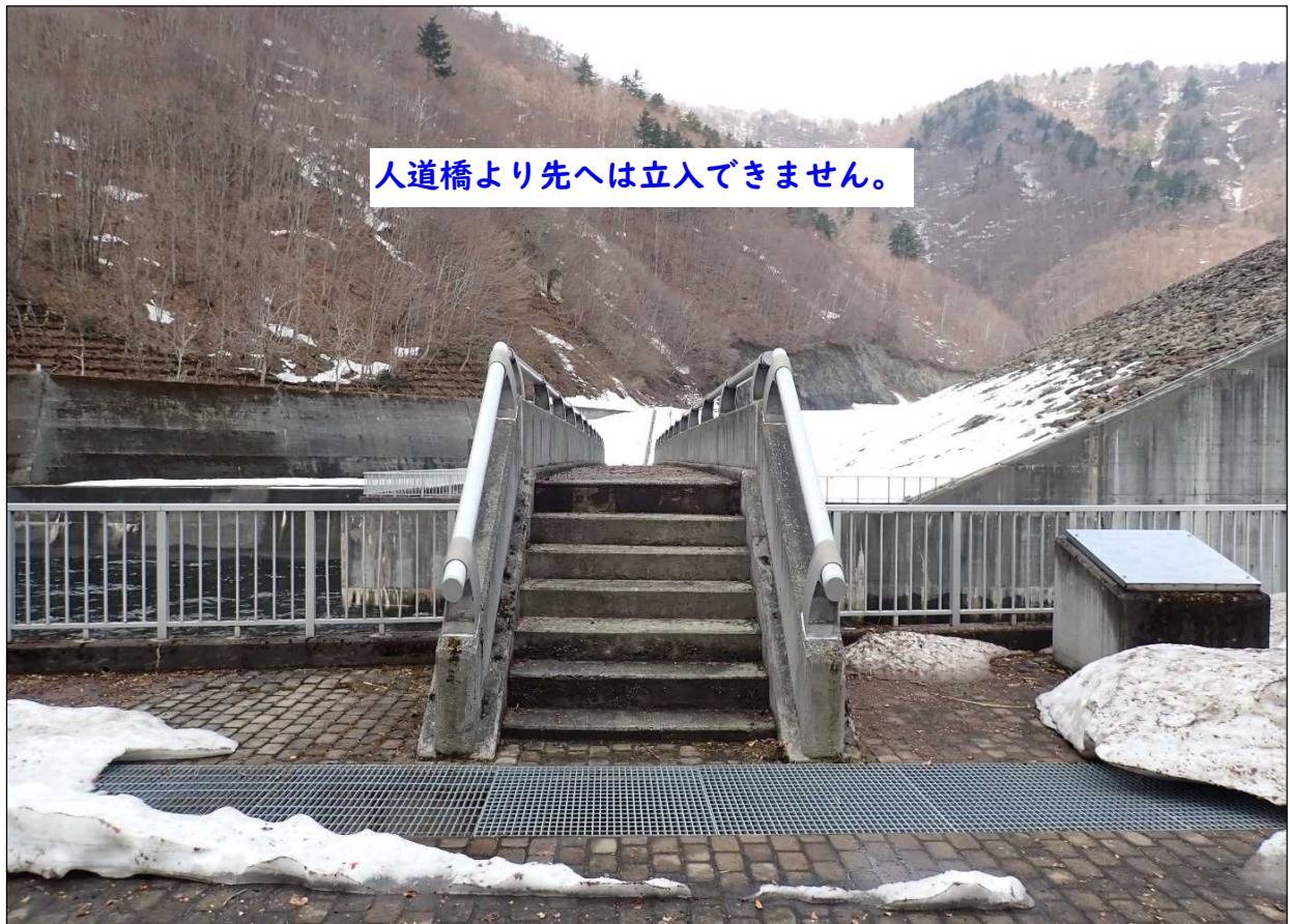
写真1 奈良俣トンネル出口