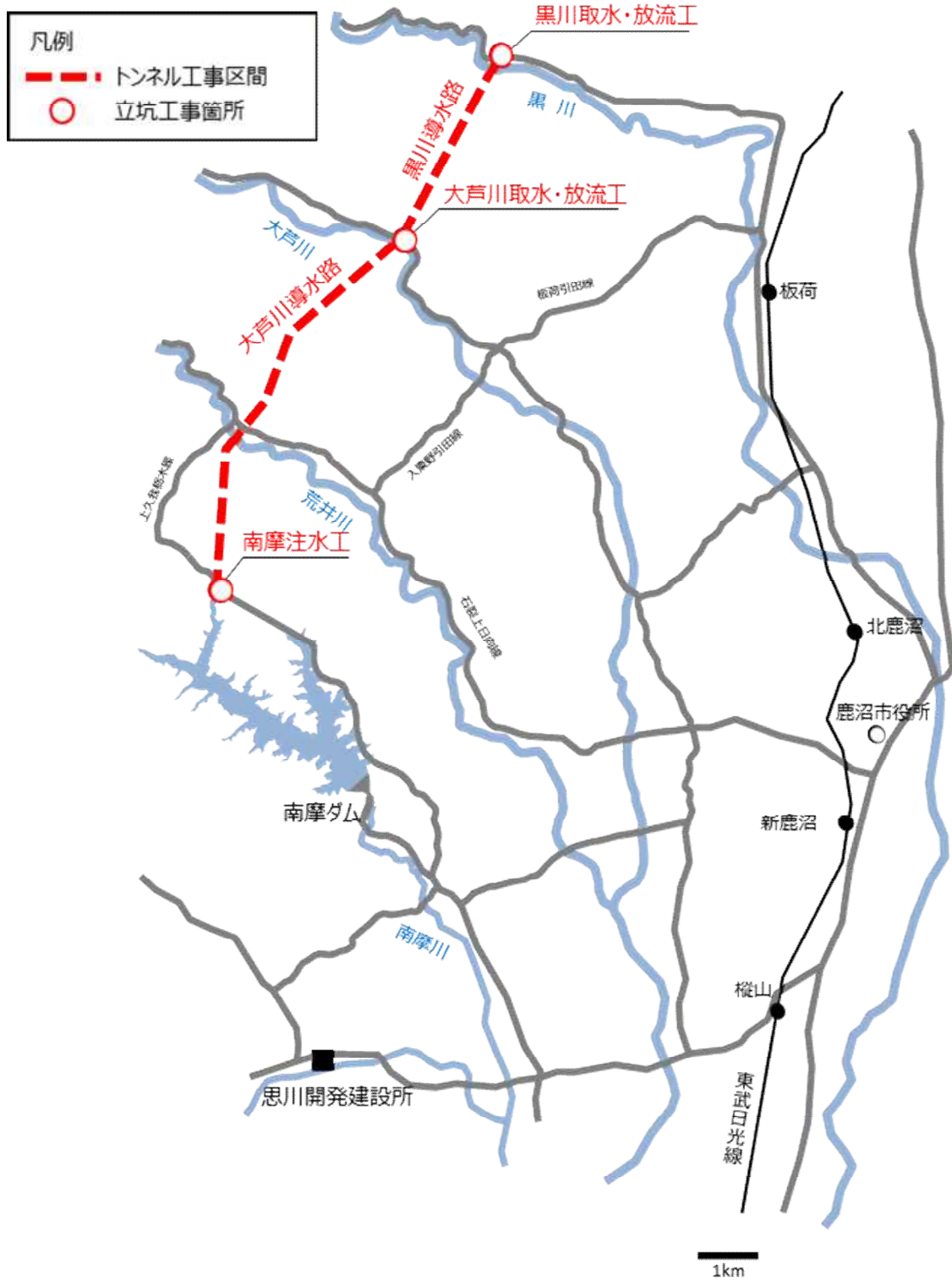
図－2 導水施設工事の位置図