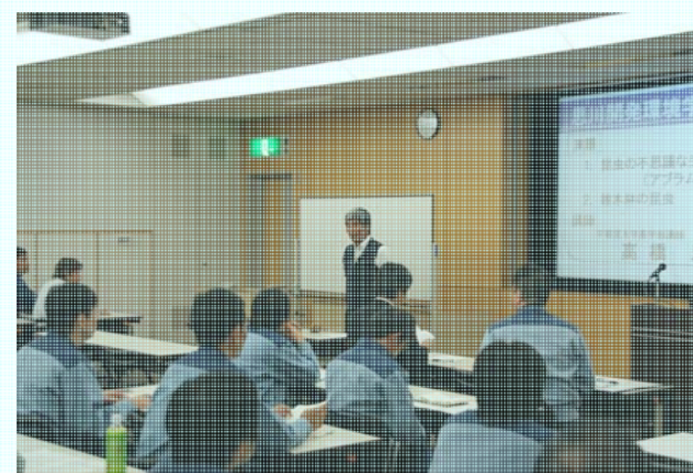
環境学習会での講演の様子

今後もこのような環境学習会を開催し、環境保全に対する職員の意識と知識の向上に努めていきたいと思っております。