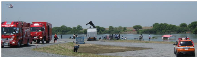
当日の水防演習の様子

国土交通省及び関東1都6県ならびに開催地である加須市の主催で、カスリーン台風決壊地点の利根川河川敷で本格的な訓練が行われ、水資源機構も参加しました。