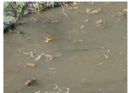
環境保全地周辺で確認された アズマヒキガエル