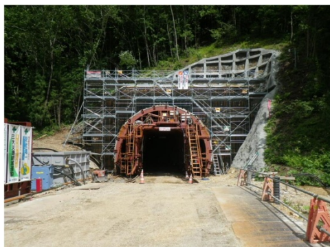
付替県道2号トンネル工事 【施工状況(平成29年6月)】

付替林道関連工事については、「和田6工区他工事(H29.3.8~H30.3.10)」、「笹之越路4工区他工事(H29.3.8~H30.2.20)」、「西ノ入1工区他工事(H29.3.14~H30.2.26)」の3工事に着手しました。