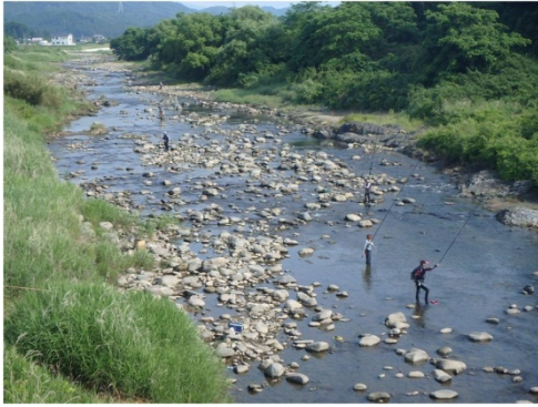
太公望で賑わう黒川（平成橋周辺）の状況

思川開発事業と関わりのある黒川、思川、大芦川などで、今年もアユ釣りのシーズンとなりました。