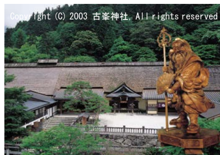
威厳ある天狗像は圧巻です。

ここで行われる「古峯ヶ原高原トレイルラン」は、知る人ぞ知る名コース。全長17キロメートルと、山野を駆ける競技であるトレイルランニングの中では比較的短距離ですが、起伏に富んだ道のりと紅葉の広がる雄大な景色は走り甲斐満点!今年の10月28日(土)に開催される第6回大会は申込受付を開始しているので、脚に自信のある方は是非参加してみてくださいはいかがでしょうか?