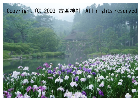
6月末からは菖蒲が見頃です!