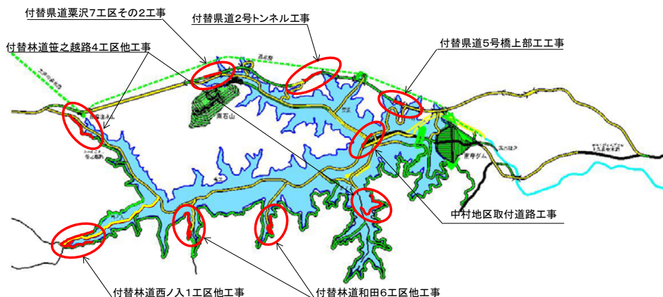
実施中の付替道路関連工事位置図(平成29年5月末時点)

工事を進めるに当たっては、環境保全対策をはじめ、工事車両の通行など安全対策にも万全を期して参ります。引き続き、ご理解とご協力を賜りますよう、お願い申し上げます。