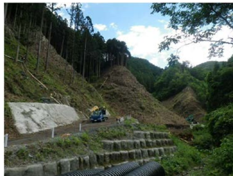
付替林道和田6工区工事 【施工状況(平成29年6月)】

工事を進めるに当たっては、環境保全対策をはじめ、工事車両の通行など安全対策にも万全を期して参ります。引き続き、ご理解とご協力を賜りますよう、お願い申し上げます。