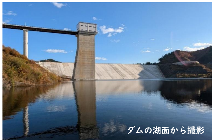
ダムの湖面から撮影