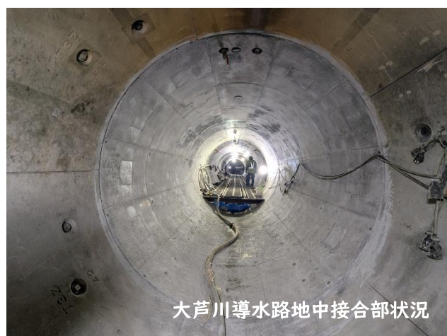
大芦川導水路地中接合部状況