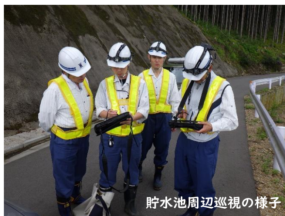
貯水池周辺巡視の様子