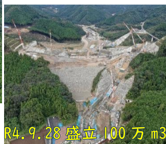
R4.9.28 盛立100万m 3