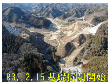
R3. 2.15 基礎掘削開始

今後とも、職員一同が一丸となり、事業完成に向けて努力してまいりますので、引き続き、ご支援とご協力を賜りますようお願い申し上げますとともに、皆様にとって良い年になりますようご祈念いたしまして新年のご挨拶とさせていただきます。