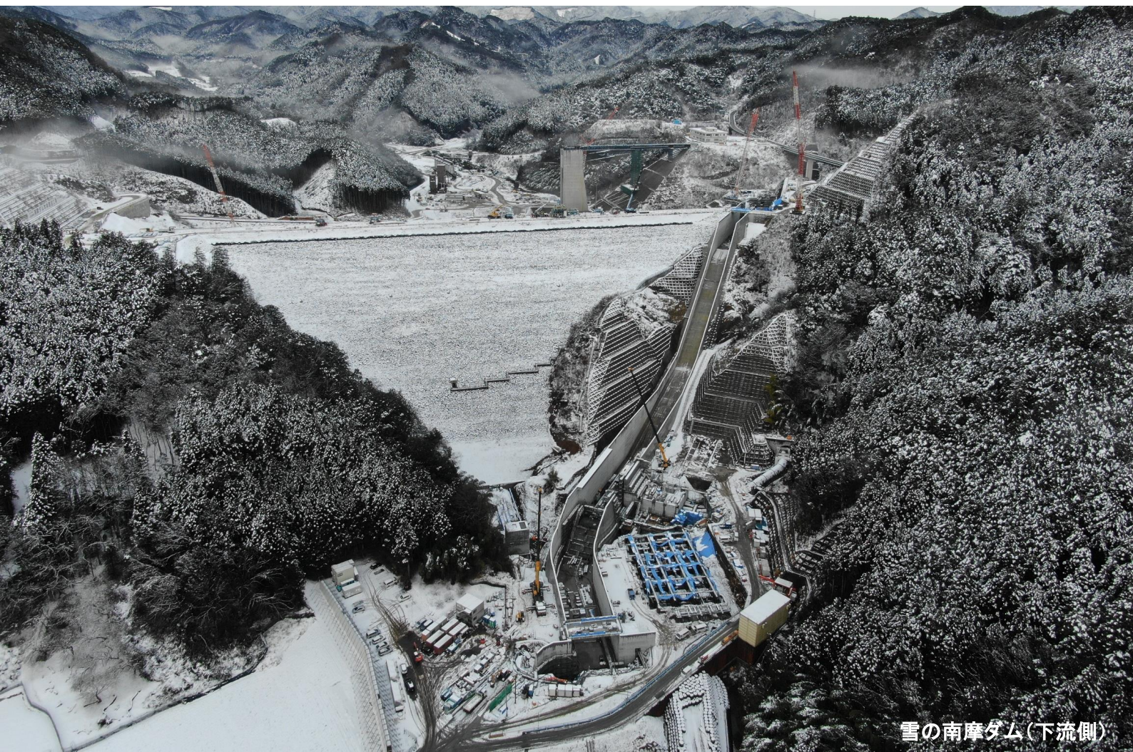
雪の南摩ダム(下流側)