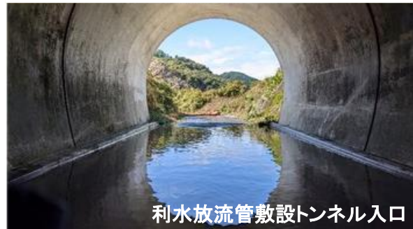
利水放流管敷設トンネル入口