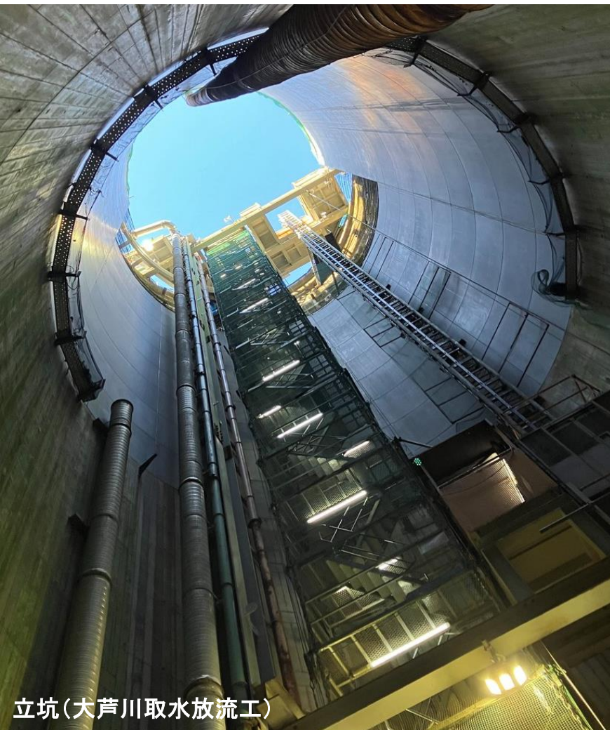
立坑(大芦川取水放流工)