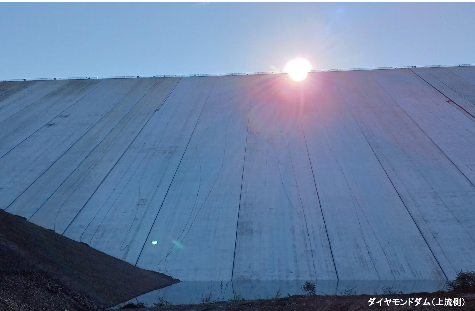
ダイヤモンドダム(上流側)