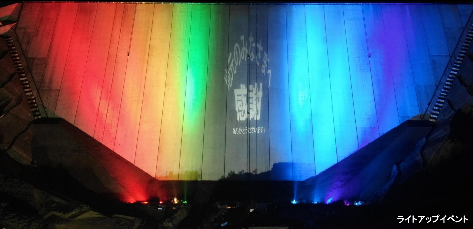
ライトアップイベント