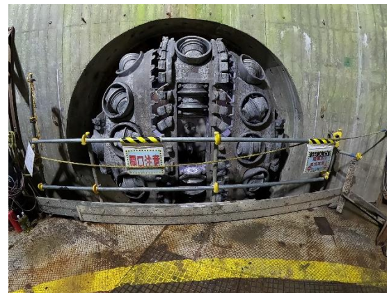
写真二 黒川導水路 終点側 (大芦川流入立坑から撮影)

現在の工事状況は、当建設所HPホームページ「工事現場LIVEカメラ」からご覧頂けます。