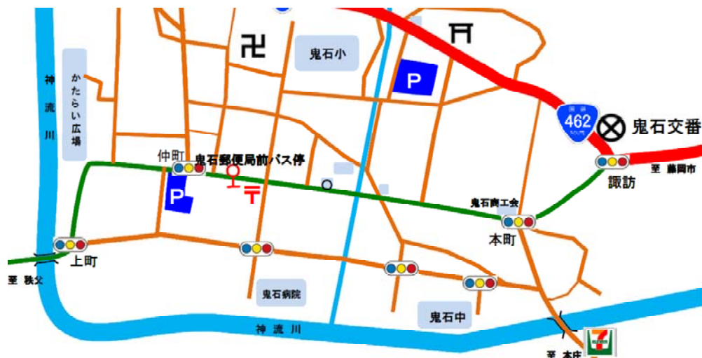
鬼石郵便局バス停案内図