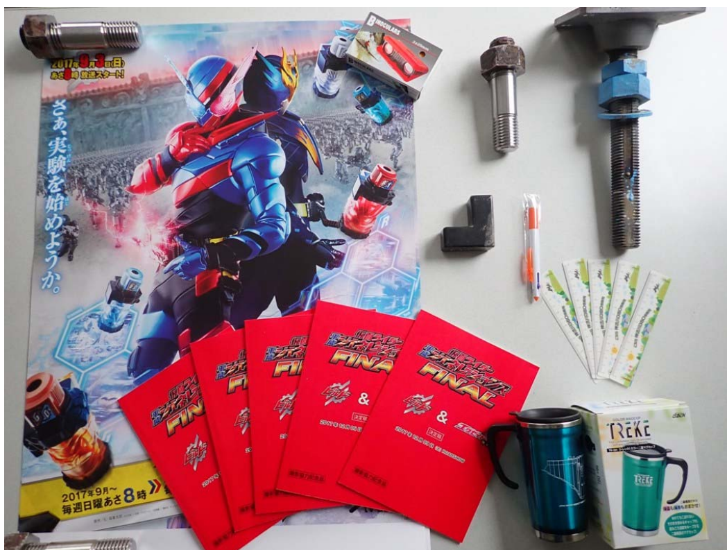
(お楽しみ景品の一例)