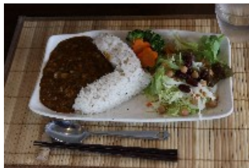
下久保ダムカレー （情報センターおにし&鬼カフェ） 群馬県藤岡市鬼石 152-1