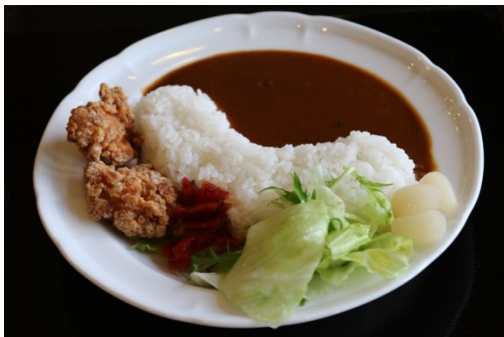
下久保ダムカレー （冬桜の宿 神泉） 埼玉県児玉郡神川町大字矢納 1431-1