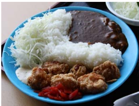
下久保ダムカレー （道のオアシス神泉） 埼玉県児玉郡神川町下阿久原 110