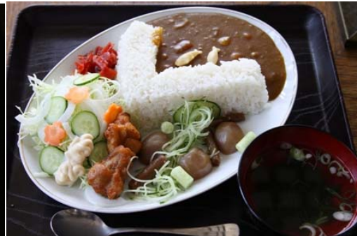
下久保ダムカレー （道の駅上州おにし 味楽） 群馬県藤岡市譲原 1089-2