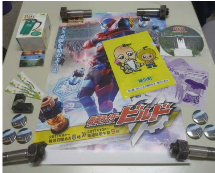
(お楽しみ景品の一例)