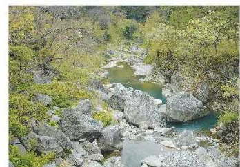
下久保ダム水環境改善事業と 土砂掃流試験により景観が蘇った三波石峡