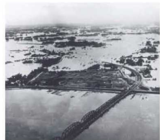
カスリーン台風によって決壊した利根川 (栗橋)