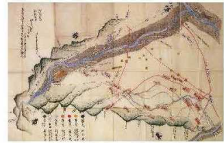
神流川八堰図 (天保 12 年) (『目で見る埼玉の開発Ⅱ』より)