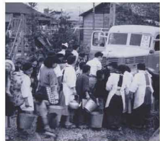
応急給水に長蛇の列 (昭和 39 年)