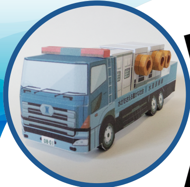
みずしげんきこう はいすい しゃ 水資源機構の排水ポンプ車