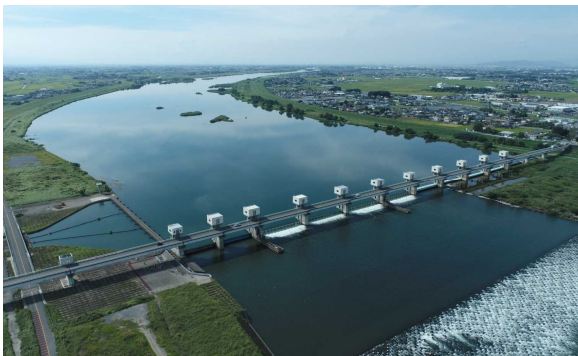
利根川 (通常時) 【令和 4 年 9 月】