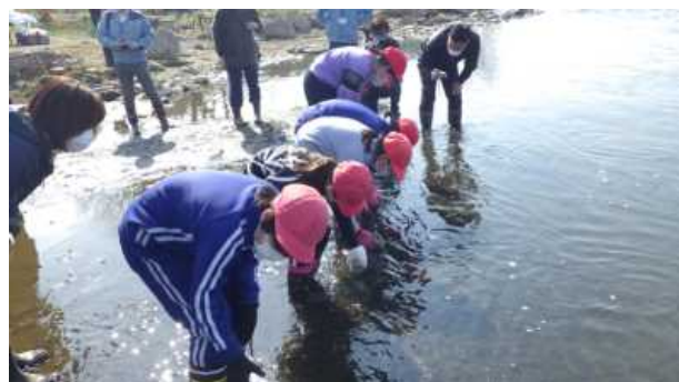
令和3年度の放流の様子