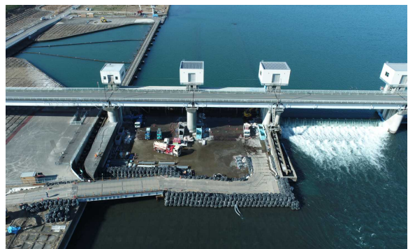
利根川の河川締切状況 【令和 5 年 1 月】