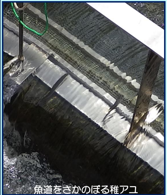
魚道をさかのぼる稚アユ