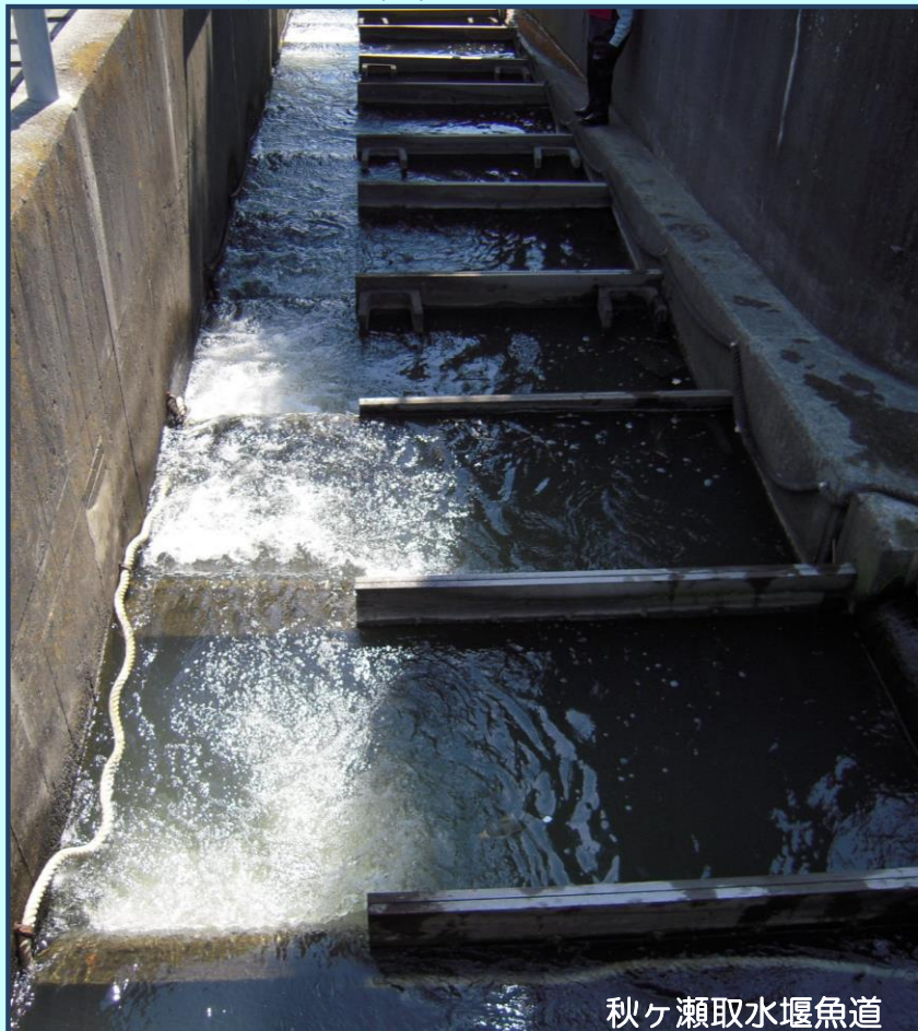
秋ヶ瀬取水堰魚道