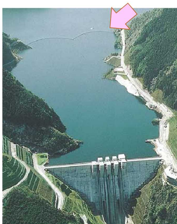
富郷ダムの流木止め