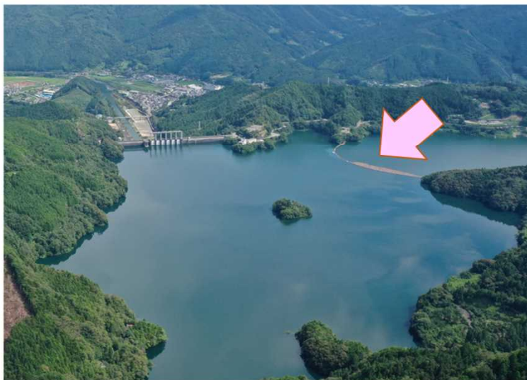
早明浦ダムの流木止め