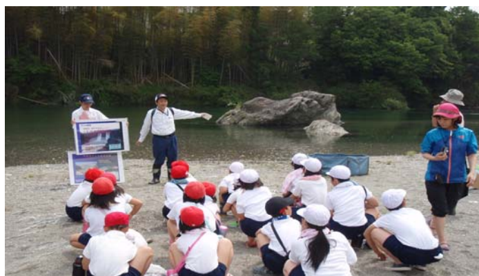
①挨拶・開催趣旨（約5分）

※60分程度で学習会を行う場合の標準的な流れです。各学校の希望等により、多少変更する場合があります。