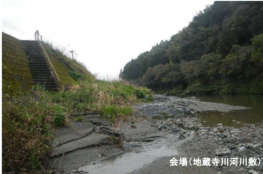
会場(地藏寺川河川敷)