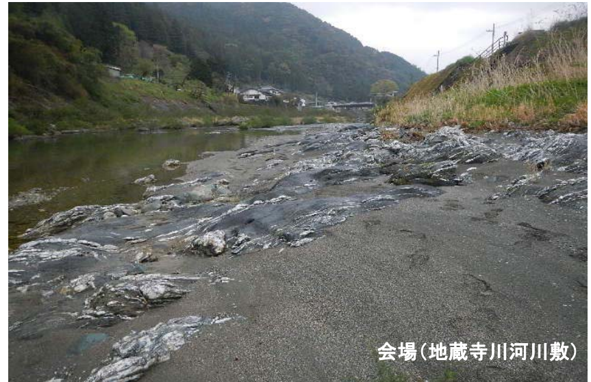
会場(地藏寺川河川敷)