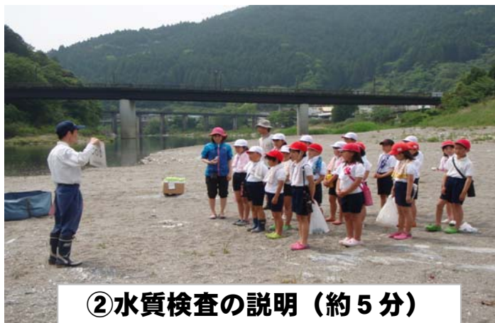
②水質検査の説明（約5分）