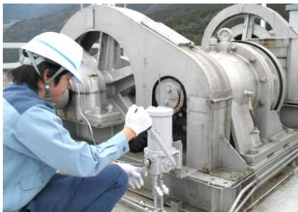
ゲート放流前の機械設備点検状況