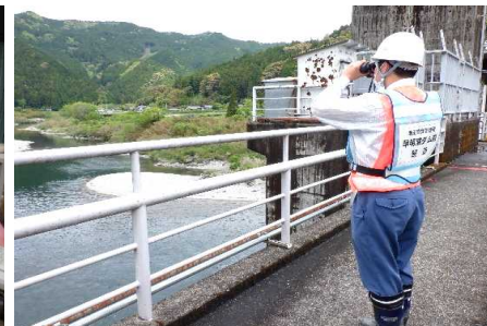
ダム下流河川の巡視状況