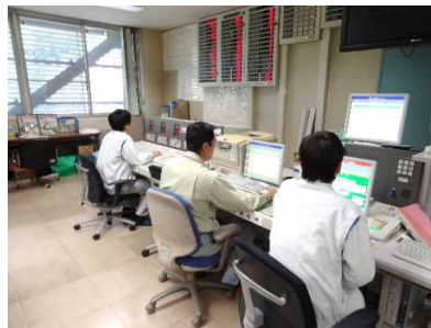
防災操作検討状況