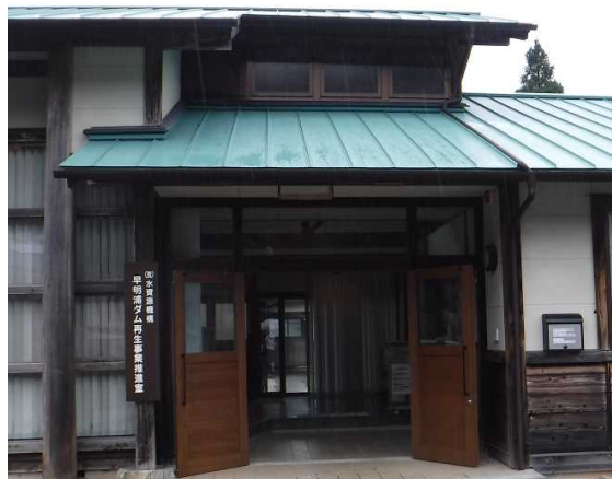
看板も新調し、新たな気持ちで頑張ります。

早明浦ダム再生事業推進室は、平成30年度から早明浦ダム管理所の一室を借り当初4名の職員でスタートしました。事業の進捗に伴い職員も事務員を含めて12名と増え、手狭になってきたことから、事務所を移転することになりました。 移転先は、土佐町土居にある「旧大工の学校」の建物を土佐町からお借りし、9月上旬から新たな気持ちで業務をスタートしました。 令和10年度の事業完了に向けて、地域の皆様のご理解を得ながら安全かつ着実に事業を進めてまいりますので、引き続きご理解ご協力をよろしくお願いいたします。