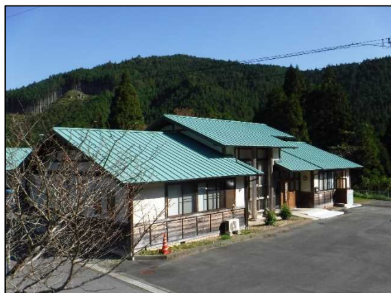
建物全景。木のぬくもりを感じる建物です。