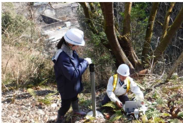
地下水位観測に取り組む様子(写真左)