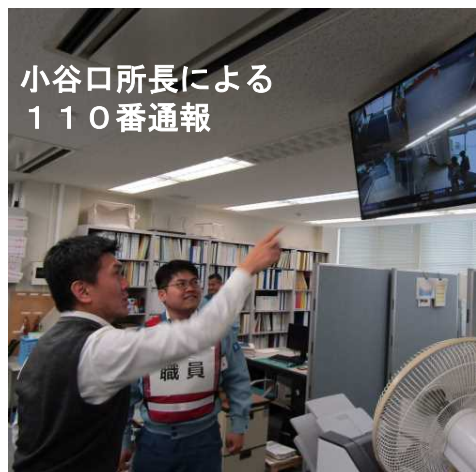
小谷口所長による 110番通報

早明浦ダムへは、令和元年度4,000人を超える見学者の来訪があったため、避難誘導や通報訓練は、管理所職員にとつてとても参考になる訓練でした。