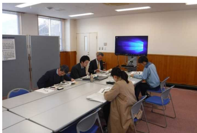
報告に真剣に聞き入る様子(写真手前)