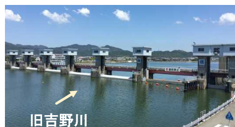
旧吉野川河口堰(右岸上流から)