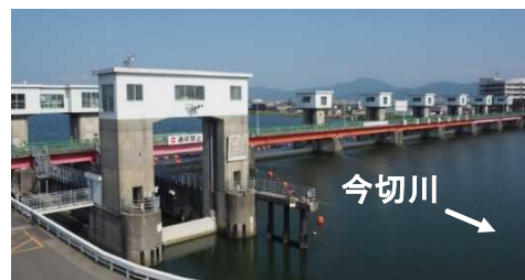
今切川河口堰(右岸下流から)